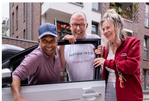
Bild 2. Mitarbeiterinnen der Stiftung