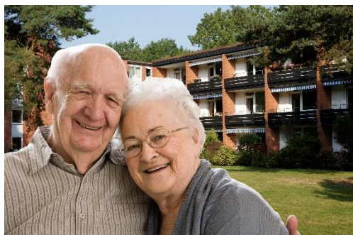
Bild 3. Hartwig-Hesse-Haus in Rissen mit Bewohnerpaar